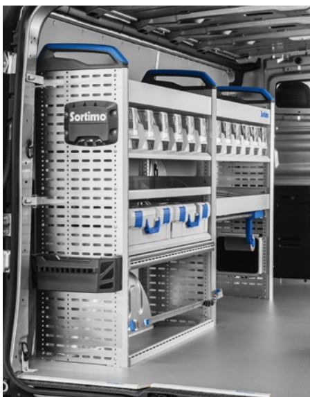
Einrichtungsblock auf der linken Seite der Ladefläche.