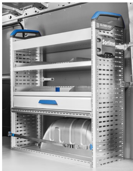
Einrichtungsblock auf der rechten Seite der Ladefläche.

Diese Einrichtung können Sie bei Ihrem Opel-Händler ganz einfach bestellen: Aktionscode: XBGR